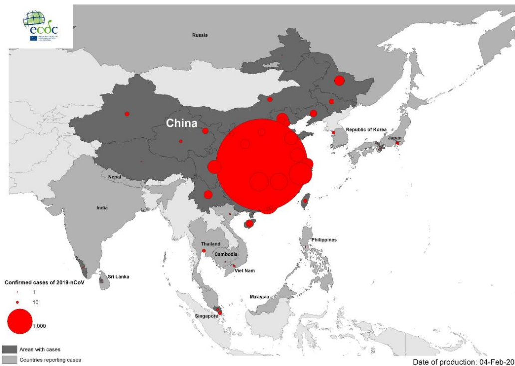
2. ábra: A 2019-NCoV okozta igazolt megbetegedés által érintett országok (ECDC 2020.02.04.)